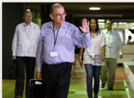
Desde noviembre del 2012, el Gobierno y las Farc dialogan en La Habana.

Recomendar 79 personas recomiendan esto. Sé el primero de tus amigos.